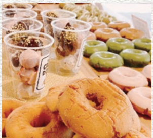
「CROWN DONUTS (クラウンドーナツ)」の店内に並ぶドーナツの多彩なラインナップ

た福田さんですが、その雰囲気はあくまで自然体。福祉とお菓子、2つの世界を自由に行き来しています。 福祉の非常勤講師として 高校生を対象に実践的指導 福祉施設の運営、ドーナツの製造・販売に加えて、福田さんにはもう一つ別の顔があります。 5年程前から、旭川市内の高校で非常勤講師として福祉分野の授業を受け持ち、高校生を対象に実践的な指導を行っているのです。 「生徒さんが飽きることがないよう、自分自身の実体験に基づいた実習指導が中心ですね。座学ではテキストではなく、パワーポイントとスライドで説明するスタイルでぞんでいます」 将来的に福祉の世界に進む可能性がある若い世代にとって、日々福祉の現場、最前線で仕事を続ける福田さんが発する言葉には、理論だけではなく実感に伴う「身近な仕事場としての現実」が感じられるのではないのでしょうか。 二刀流、二足の草鞋ならぬ三刀流、三足の草鞋。 「いつ休んでの？」と知人から心配されてしまうと笑う福田さんですが、そのやわらかな笑顔は充実感であふれ、忙しさを楽しんでいるかのようでした。