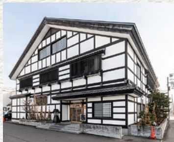
北の富士櫻屋よりプレゼントがございます。PRESENT PICK UPIをご覧ください。