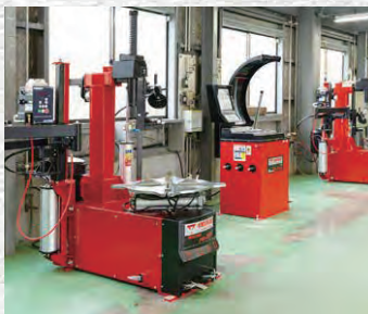
道輪工業株式会社よりプレゼントがごさいます。 PRESENT PICK UP!をご覧ください。

信頼と実績のタイヤ専門店に 豊岡店が新規オープン！ 自動車部品の中で唯一、路面と接地し自動車にとって大切な部品であるタイヤ。同店はタイヤ・ホイールの販売から整備・保管などを行い、旭川市で80年近く安心・安全なカーライフを支えています。国内から海外まで幅広いメーカーを扱い、お客様のニーズやご予算に合わせて最適な提案をしていきます。 車に個性を持たせるホイールは、パソコンで装着したときのシミュレーションを見ることが可能。整備ではプロ意識を持ったスタッフが、長年の実績と培った技術で正確かつ迅速な作業を行い、さらにお客様の大切な車をあずかるという意識で丁寧さも心がけています。 そしてこの8月28日には豊岡店がオープン。こちらでは整備を完全予約制にすることにより実質作業時間のみで、待ち時間をさらに短縮。タイヤチェーンやバランサーなど最新の機器も導入しています。気さくで親切なスタッフが応対してくれ、女性スタッフもいるので、初めての方や女性の方も気軽に「こ来店」いただけます。 夏が終わったら、そろそろスタッドレスタイヤの準備も考えたいところですね。タイヤに関するお困りごとなら、ぜひこちらにご相談を。